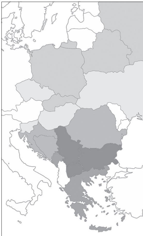
Fig. 2: Anteile der Patronymika in der Slavia und auf dem Balkan

Republik. Etwas stärker wiederum ist sie in der nördlichen Zone vertreten, die Rußland, Belarus, Polen und die Slowakei umfaßt. Dies also, um es noch einmal deutlich zu konstatieren, ist der neue (onomastische) Balkanismus, der hier vorgestellt werden sollte: eine klare oder überwältigende Dominanz der Patronymika unter den 10 bzw. 20 häufigsten Familiennamen , die, wie oben gezeigt, leicht 50% aller Vorkommen ausmachen. Die Areale der verschiedenen Intensitäten dieser Erscheinung fällt dabei weitgehend mit den Bereichen zusammen, die man auch aus anderen sprachlichen Erscheinungen kennt, und die natürlich mit der Dauer und Intensität der osmanischen Herrschaft auf dem Balkan korrelieren. Wenn die genannte Erscheinung typisch für den Balkan ist, so bedeutet das natürlich im Umkehrschluß nicht, daß sie anderswo nicht vorhanden sein könnte bzw. dürfte. So fällt z.B. auf, daß die Angaben zu St. Petersburg oben von den Angaben für ganz Rußland deutlich abweichen: in St. Petersburg haben wir ebenfalls schon unter den häufigsten 10 Familiennamen viele Patronymika (nämlich 7).